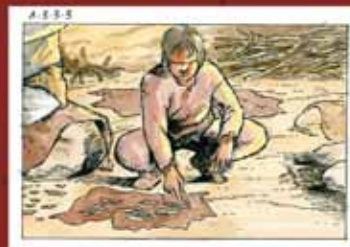
Aquestes vinyetes pertanyen al story-board que l'Oriol va realitzar per a un documental produït pel Museu de Alaminos