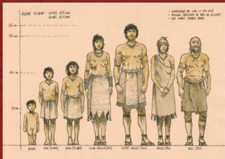
Parc Arqueològic de les mines neolítiques de Gavà