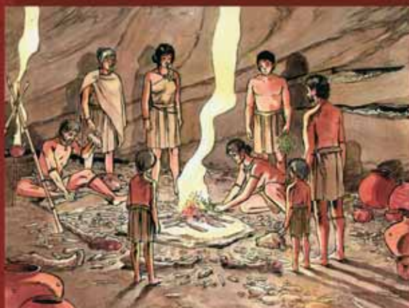
Museu de les coves des Càrritx i des Mussol (Menorca)

El seu treball com a il·lustrador també es pot gaudir en diversos museus i centres culturals, com el Museu d'Història de Catalunya, la Ruta dels Ibers, el Museu dels Raiers de Coll de Nargó, el Museu Arqueològic de Mojà, el Museo Arqueológico Regional de la Comunidad de Madrid, el Parc Arqueològic de les mines neolítiques de Gavà o el Centre Arqueològic de l'Almoina de València.