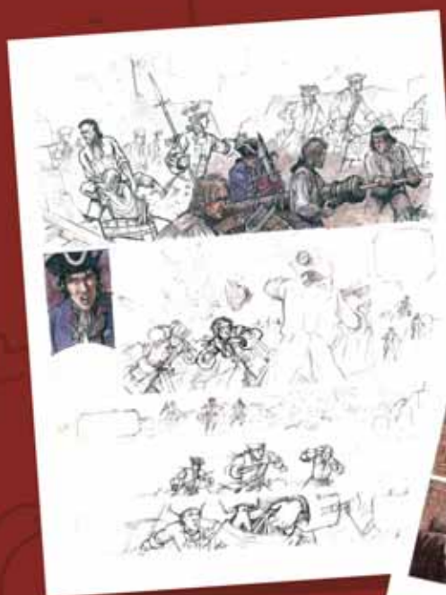
A l'esquerra, esboss i estudi de color d'una pàgina de prova de Barcelona 1714. L'Onze de setembre: a la dreta, dues pàgines acabades d'aquest llibre