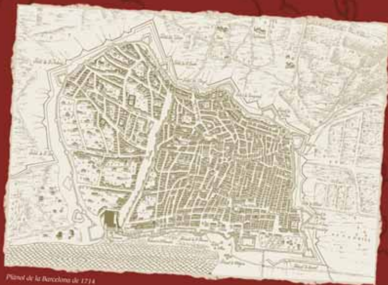
Plànol de la Barcelona de 1714

L'àlbum va ser finalment publicat per Editorial Casals, amb el suport de la Generalitat de Catalunya, i presentat en públic per l'historiador Josep M. Ainaud de Lasarte el 18 de setembre del 2002, a l'històric Convent de Sant Agustí. Convent on, com es narra al còmic "...s'aturà la penetració de l'enemic enmig d'una lluita embogida, on es disputà passadís per passadís i cel-la per cel-la..."